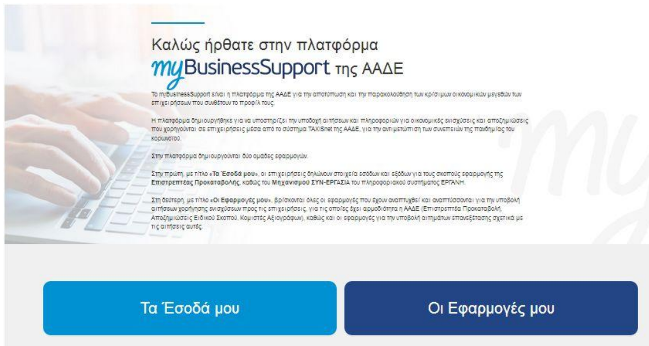
Εικόνα 1: Σελίδα της εφαρμογής στον διαδικτυακό τόπο της ΑΑΔΕ

Η σελίδα της εφαρμογής στο διαδικτυακό τόπο της Α.Α.Δ.Ε. είναι η παρακάτω. Για την είσοδο ο ενδιαφερόμενος επιλέγει «Οι εφαρμογές μου»